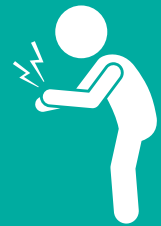
dureri articulare la femeile adulte

Principalul simptom al rubeolei este o erupție cutanată punctiformă care începe pe față sau în spatele urechilor și se răspândește pe gât și pe corp. Erupția apare de obicei la 2 - 3 săptămâni după contractarea rubeolei. Alte simptome includ tuse, strănut, curgere a nasului și durere în gât. Rubeola este, de obicei, ușoară și unele persoane nu prezintă niciun simptom.