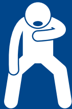
durere la înghițire